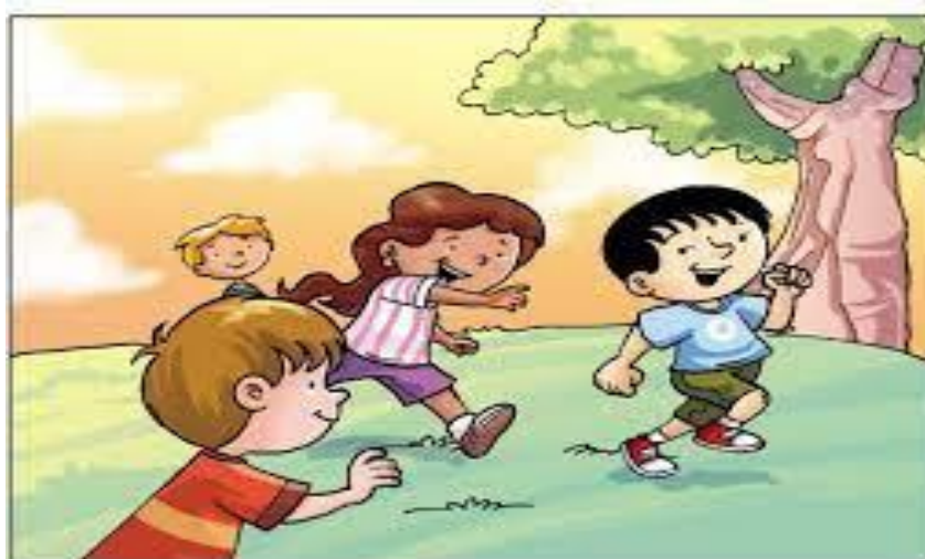
FIGURA 07 – Jogo cooperativo: Pega pega corrente