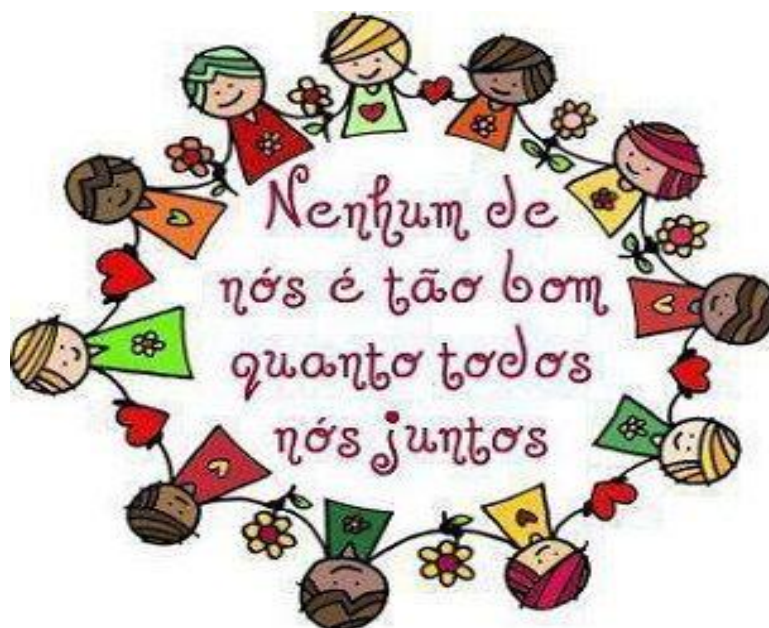
FIGURA 8 – Mensagem de Cooperação revelado no final do Torneio das Virtudes

Então todo juntos estarão diante da mensagem completa, fruto do trabalho e do esforço de todos para alcançar o almejado objetivo de descobrir enfim o verdadeiro significado da cooperação, visualizando então a mensagem: “ Nenhum de nós é tão bom quanto todos nós juntos! ” (FIGURA 08).