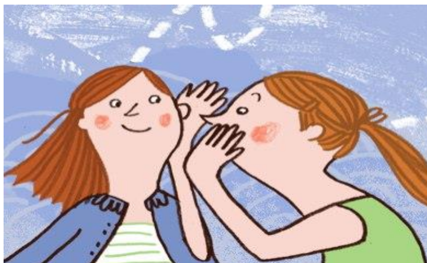
FIGURA 04 – Jogo cooperativo: Telefone sem fio