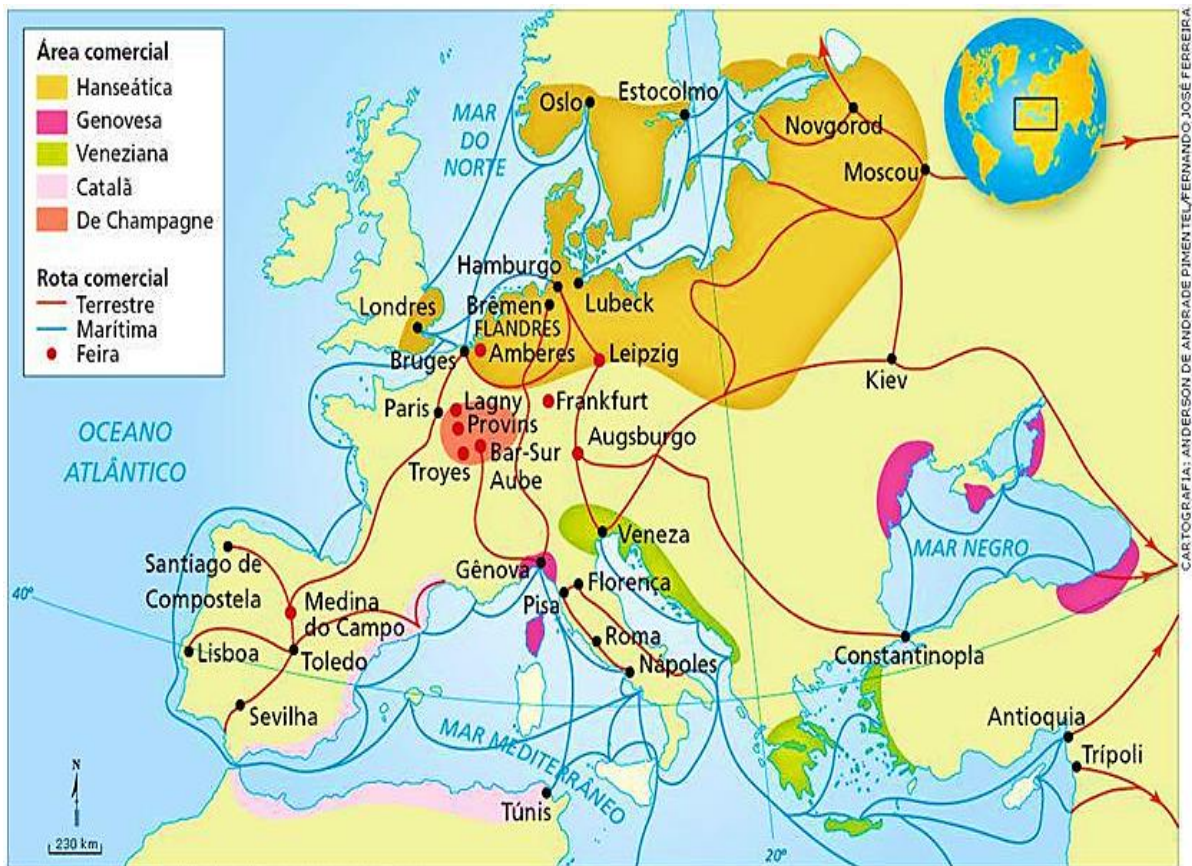
FIGURA 02 – Mapa das principais rotas de comércio mediterrâneo dos séculos XII e XIII

Na figura 02, apresentamos o mapa das principais rotas de comércio mediterrâneo dos séculos XII e XIII.