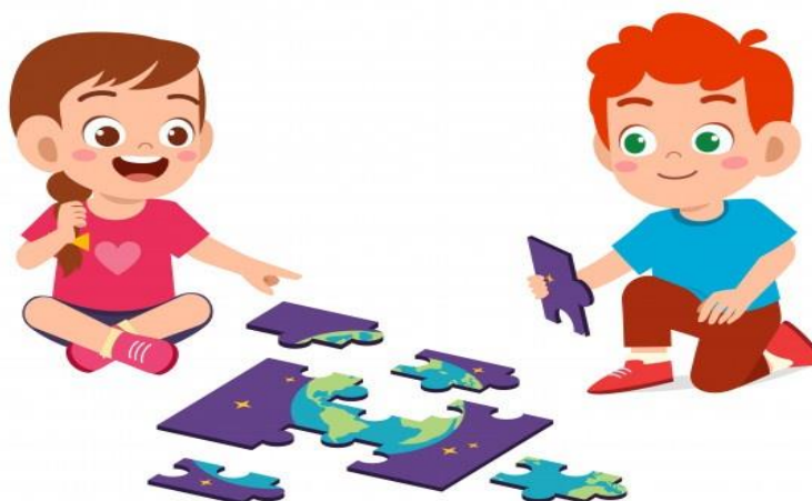
FIGURA 06 – Jogo cooperativo: Quebra cabeça

Após os dois grupos terminarem com êxito, a turma receberá o envelope número 2 e colará junto com o primeiro no mural, passando assim para o terceiro jogo cooperativo: o Quebra cabeça (FIGURA 06).