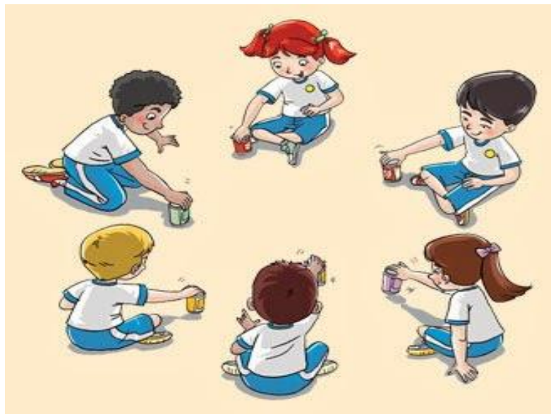
FIGURA 05 – Jogo cooperativo: Escravos de jó