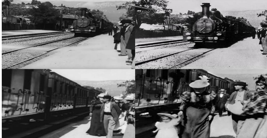
Figura 1 - A chegada do trem a estação, dos irmãos Lumière.

seu início. Os primeiros filmes, como "A saída dos operários da fábrica Lumière" 7 e "A chegada do trem" 8 , projetados pelos irmãos Lumière, causaram um espanto inicial no público, que se viu diante de imagens em movimento pela primeira vez (FRESQUET, 2013).