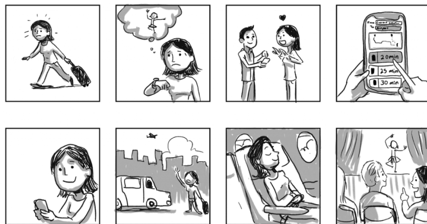
Figura 14 – Exemplo de um Storyboard

tomadas". Os storyboards podem ser caracterizados como esboços de planos e enquadramentos feitos para serem usados como base para a realização das filmagens. Lembram histórias em quadrinhos, porém, não contêm diálogos ou qualquer tipo de anotações, mas sim apenas imagens. Dessa forma, os storyboards devem ser produzidos antes das filmagens, o que seria um exercício de pré-produção, contendo sequências de imagens que posteriormente serão filmadas. Para uma melhor visualização, segue um exemplo de storyboard retirado do blog "Awari", publicado no ano de 2022.