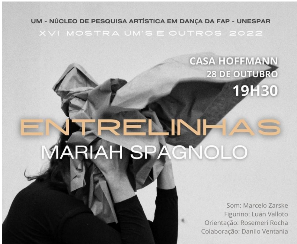
Figura 17 - Cartaz de divulgação da apresentação de Entrelinhas na XVI Mostra UM's & Outros realizada em 2022

Na imagem abaixo é possível ver o cartaz de divulgação do evento, no qual aconteceu a estreia da obra Entrelinhas .