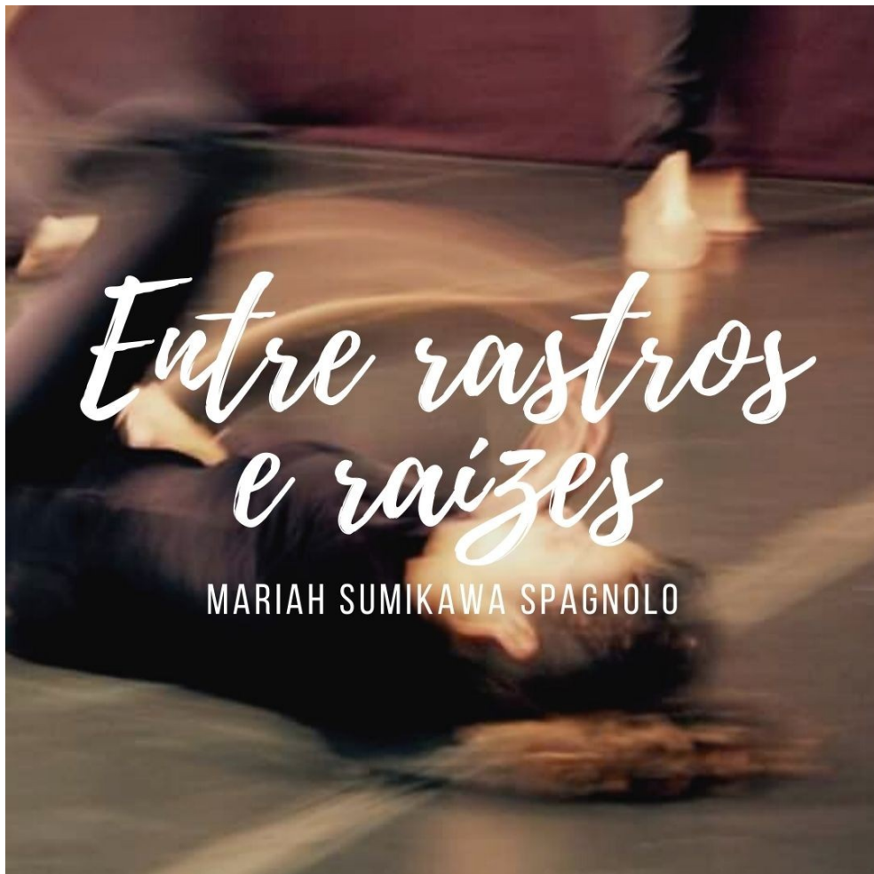
Figura 14 - Imagem utilizada para divulgação da ilha no perfil do Instagram @umnucleo

A imagem apresentada abaixo foi a mesma imagem compartilhada no Instagram 28 do UM 29 para apresentar o tema do meu grupo de estudo, as questões práticas do seu funcionamento e também para convidar as pessoas que quisessem integrar este espaço de estudo. O nome do meu grupo ou, como chamávamos, da minha Ilha, era "Entre Rastros e Raízes".