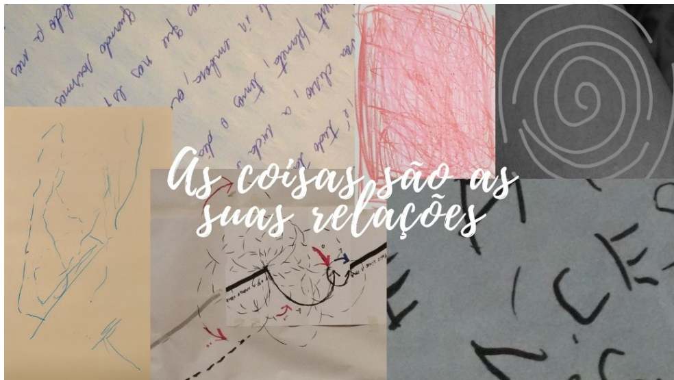
Figura 10 - Imagem editada com recortes de fotos de desenhos para o projeto Arquipélago do UM – dentro da ilha Entre rastros e raízes 2021

É nessa perspectiva que aparece a história como um atravessamento da pesquisa. O sujeito pesquisador que reflete e investiga é o sujeito encarnado, conceituado por Najmanovich (2001), que carrega sua história, seus interesses e encantos. O estudo da linha, dessa maneira, se faz corporalizado nas experiências que constituem o sujeito desta pesquisa.