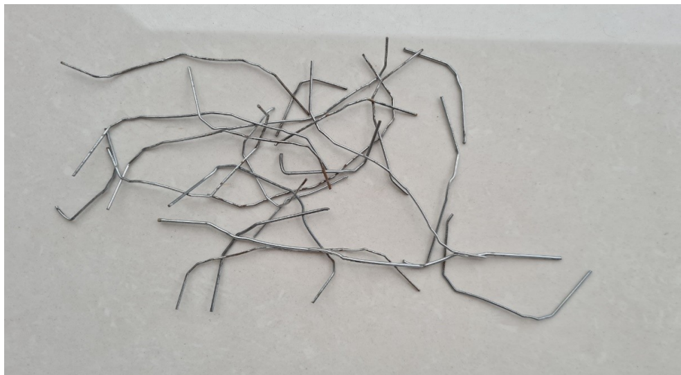
Figura 9 - Experimento realizados com cliques de papel para estudo sobre fios em 19 de novembro de 2021

Ao perceber que alguns dos cliques já estavam começando a enferrujar, resolvi que seriam jogados no lixo. Mas, antes disso, abri todos eles, desfazendo o seu formato de clipe de papel e os transformando em fios de ferro como é possível observar na imagem abaixo.