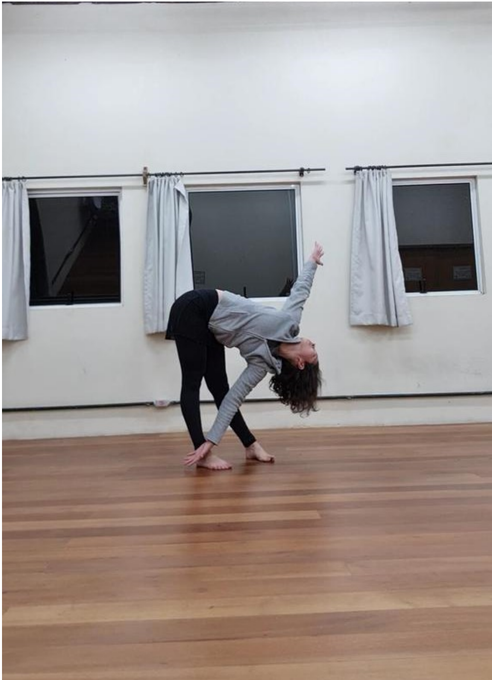
Figura 12 - Foto tirada no ensaio realizado no dia 22 de maio de 2022 no Teatro Laboratório do Campus de Curitiba II - UNESPAR/FAP