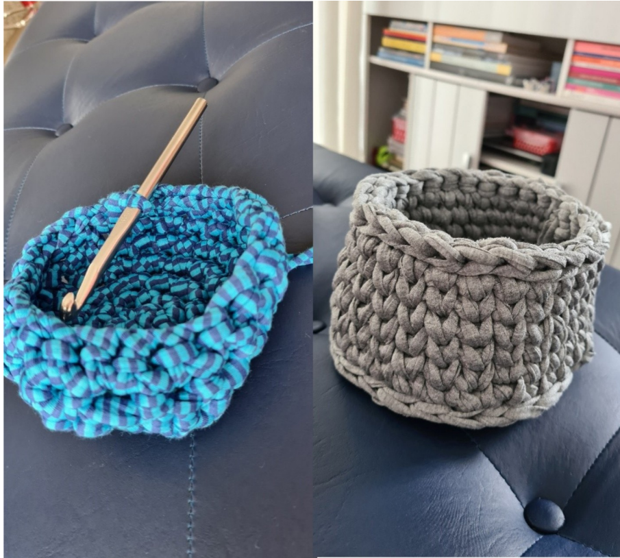
Figura 1 - Imagens de cachepôs que aprendi a fazer nas aulas de crochê com a artista Juliana Alves