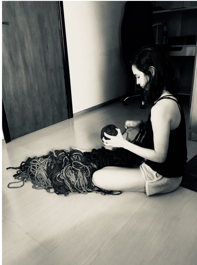
Figura 11 - Registro de 01 de dezembro de 2017 desembolando fios de malha