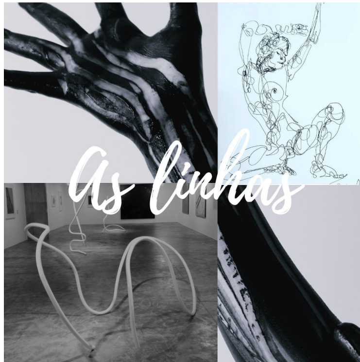
Figura 8 - Imagens editadas por Mariah para a ocupação da Ilha Entre Rastros e Raízes (1) no instagram do @umnucleo em 2021

Na imagem abaixo é possível detectarmos três exemplos de tipos de linhas. O antebraço e a mão pintados com tinta preta e traços de remoção da tinta que formam linhas ao longo do membro são considerados traços de marca removida. Já na imagem no canto superior do lado direito, por ser um desenho 16 , representa o traço com marca de adição na superfície. Por último, a imagem no canto esquerdo inferior apresenta esculturas 17 feitas com estruturas finas e compridas de ferro torcidas e pintadas em branco, o que, dessa forma, são consideradas fios, por possuírem uma superfície.