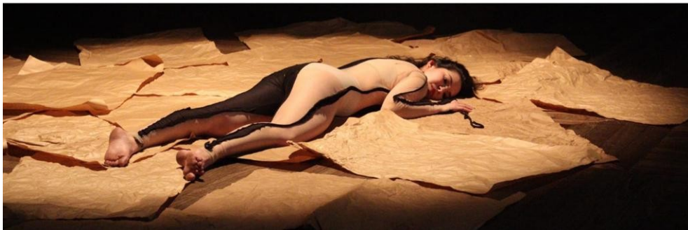
Figura 19 - Foto da estreia da obra "Entrelinhas" na mostra UM's & Outros produzida pelo UM em 2022

Enquanto as pessoas ocupavam a sala do andar de baixo da Casa Hoffmann 36 , algumas dezenas de folhas de papel Kraft estavam espalhadas pelo chão. Eu estava deitada, por cima das folhas, atenta ao meu estado corporal e percebendo o peso e as bases corporais que tocavam o chão e o papel.