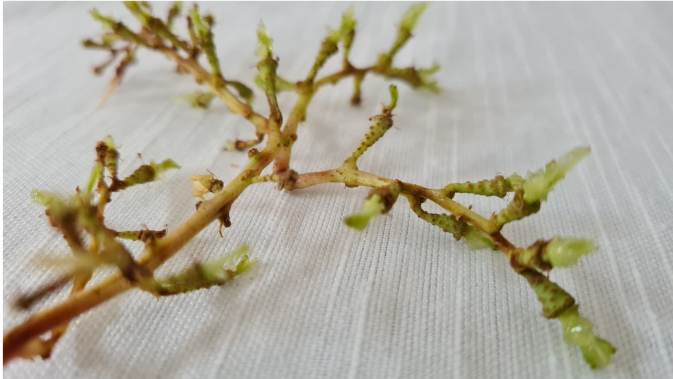
Figura 7 - Imagem de um cacho de uvas sem uvas, somente com o tronco

As linhas são um fenômeno em si mesmas. Elas estão em nós, em nossos tecidos corporais, nas palmas de nossas mãos e também estão ao nosso redor; nas folhas das árvores, nas rachaduras de concreto e nos rastros que deixamos por onde passamos. As linhas estão por toda parte e de muitas formas. Esta diversidade é condição para sua existência (INGOLD, 2015).