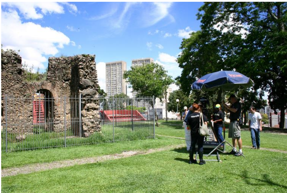
Figura 4: filmagens nas Ruínas de São Francisco, Curitiba.

O filme Em busca de Curitiba perdida é uma trabalhosa transposição cinematográfica de um dos mais famosos contos do escritor paranaense Dalton Trevisan, que faz parte do livro Mistérios de Curitiba , de 1968. O esforço cinematográfico desse trabalho deve-se à fidelidade que guarda com o conto, uma atitude técnica desenvolvida a partir de uma relação de cumplicidade com a literatura de Trevisan. Por essa razão, é preciso conjugar o cinema no plural, pois se trata de uma arte coletiva, que abriga, em si mesma, outras artes.