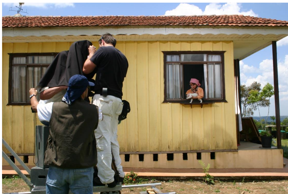
Figura 3: Criança com gato na janela

Em um segundo momento, quando o filme dá lugar a uma cena bucólica em que uma criança aparece brincando na janela com seu gatinho (04:18-04:55 ), a narração remete a uma cidade sem asfalto, com suas ruas de barro, talvez uma vida triste que contrasta com a primeira cena de uma cidade fria de cimento de concreto armado, a que se refere o autor.