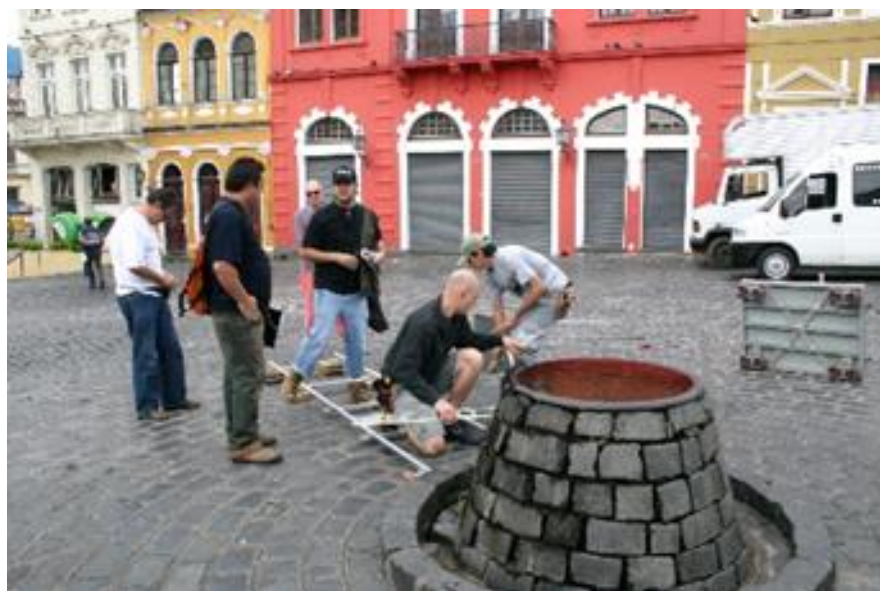
Figura 1: Making of do filme

casamento entre Literatura e Cinema os contos de Trevisan: Ezequiel , realizado em 1995; Que Fim Levou o Vampiro de Curitiba? , de 1996; Retrato 3X4 , realizado em 1997; O Escapulário , em 2001; Punhal na Garganta , em 2003; Penélope , em 2004; Balada do Vampiro , de 2006 (filme em 35 mm); Fatal , finalizado em 2008. Posteriormente, ao reler e analisar sua obra, em 2008, realizamos o filme Em Busca de Curitiba Perdida . Essa obra cinematográfica pode ser considerada a síntese da transposição para o cinema do olhar de Trevisan sobre a cidade de Curitiba. Projeto ousado, na medida em que transformamos uma ficção escrita pelo grande contista, em um filme do gênero documentário.