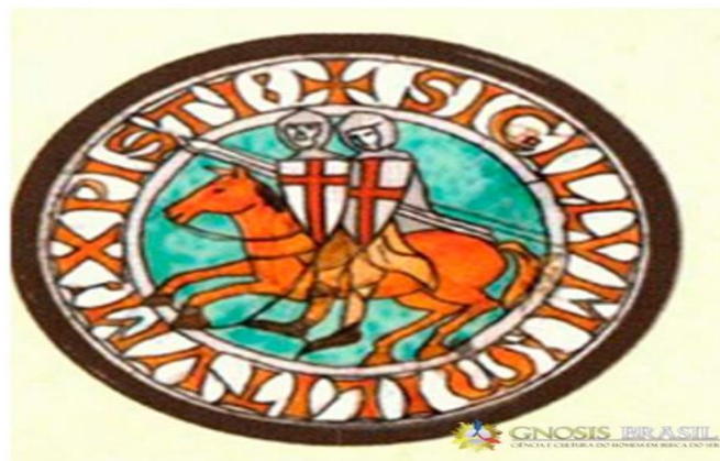
Figura 1 - Símbolo da Ordem dos Templários

Um dos pontos relacionados à questão do exercício dos cavaleiros em prol da espiritualidade era as suas vestimentas e instrumentos utilizados, como demonstrados na figura a seguir, pois carregavam significados e justificativas a serem sempre lembradas sobre a sua fé.