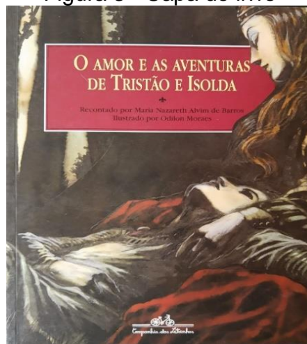
Figura 3 - Capa do livro

2º Realizar questionamentos sobre a imagem apresentada.