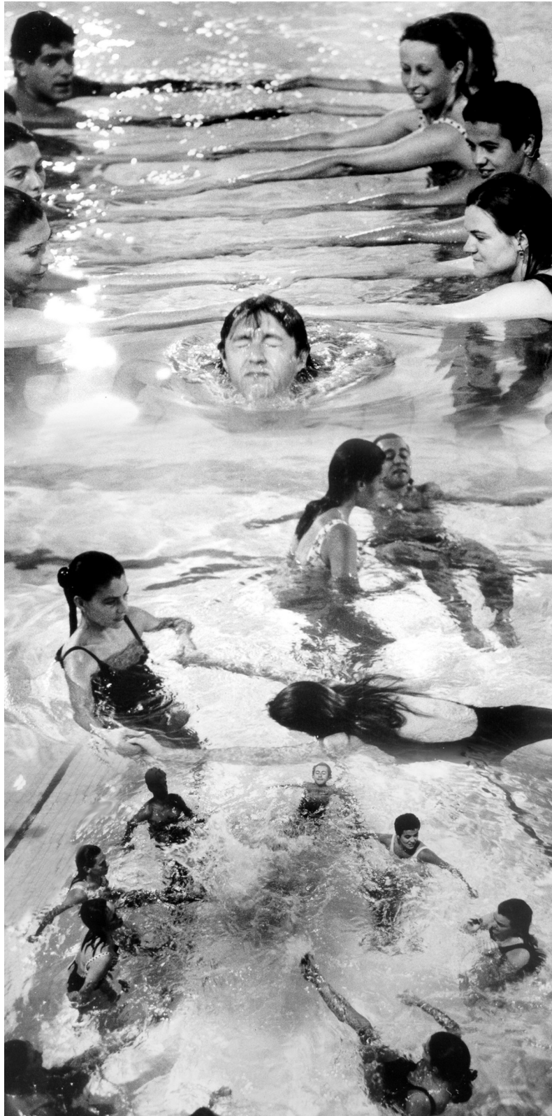
Figura 2: Oficina Meio Líquido