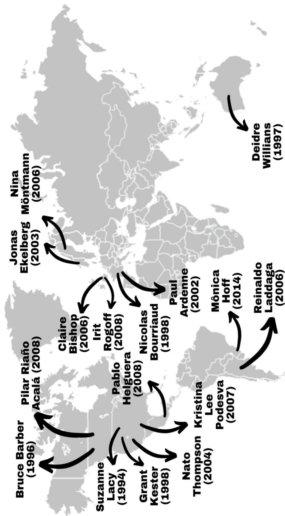
Figura 1: Cartografia de teóricos de acordo com suas nacionalidades