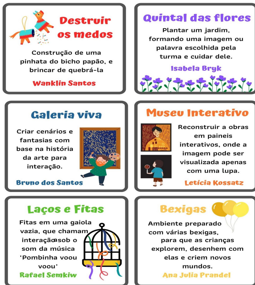
Figura 5: Criação-Ensino

A partir disso, destaco (ver figura 5) algumas possibilidades elaboradas pelas turmas. Escolhidas de acordo com seu potencial artístico e didático, bem como a partir de sua possibilidade de síntese.