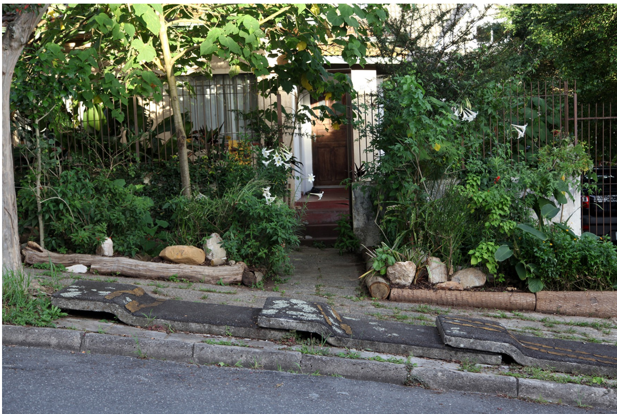
Figura 4: Transborda Jardim