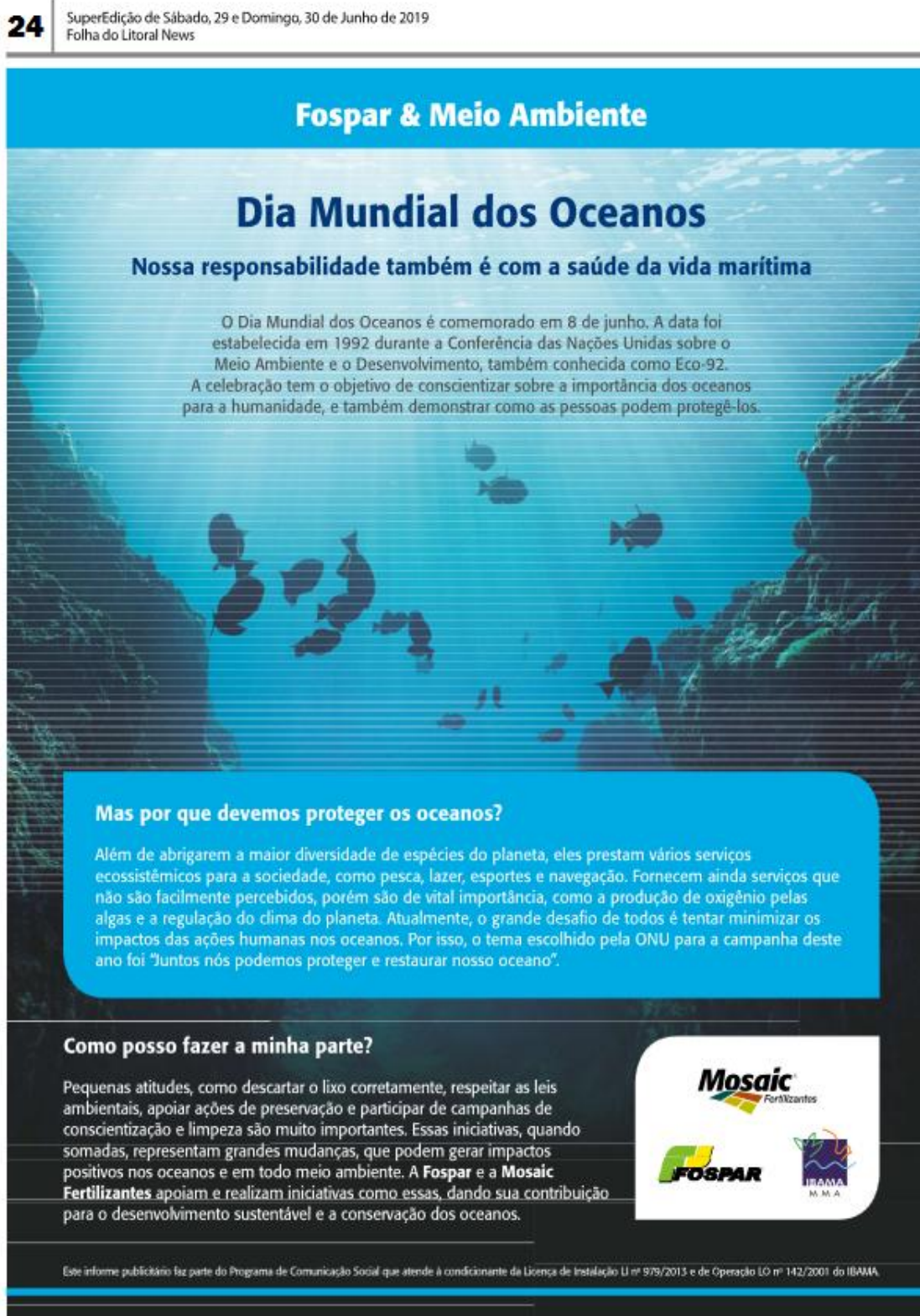
Figura 2. Publicação Obrigatória no Jornal Folha do Litoral News no Sábado, 29 e Domingo, 30 de junho de 2019.