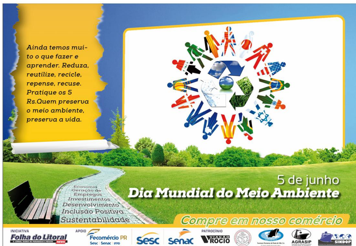
Figura 3. Publicação Temas Diversos no Jornal Folha do Litoral News na Sexta-feira, 5 de Junho de 2020.