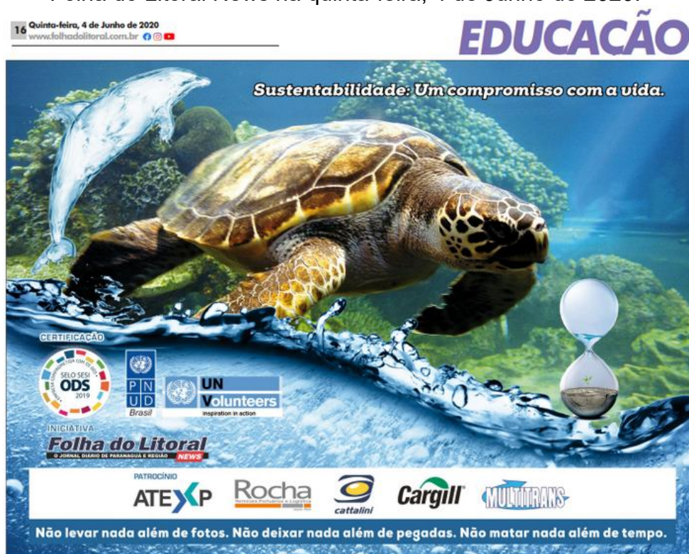
Figura 1. Publicação do projeto Mar no caderno de Educação do Jornal Folha do Litoral News na quinta-feira, 4 de Junho de 2020.